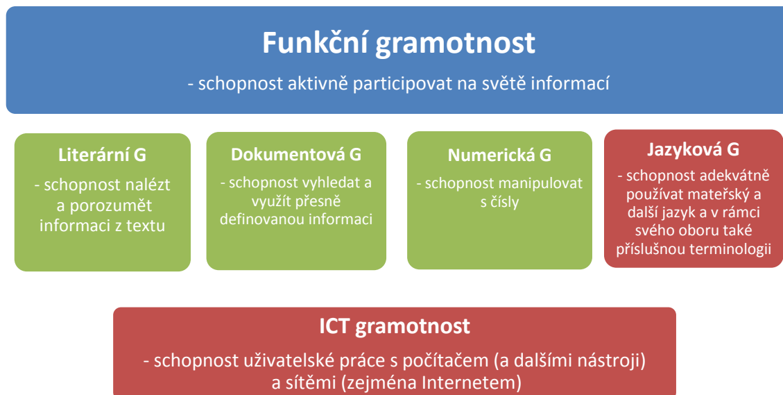
Obrázek 1 Model funkční gramotnosti obohacený o ICT gramotnost 4

Obrázky se číslují jednotně od začátku do konce práce. Titulek (velikost písma 10) se umísťuje vždy pod obrázek. Obrázek je zároveň uveden v úvodní části práce v Seznamu