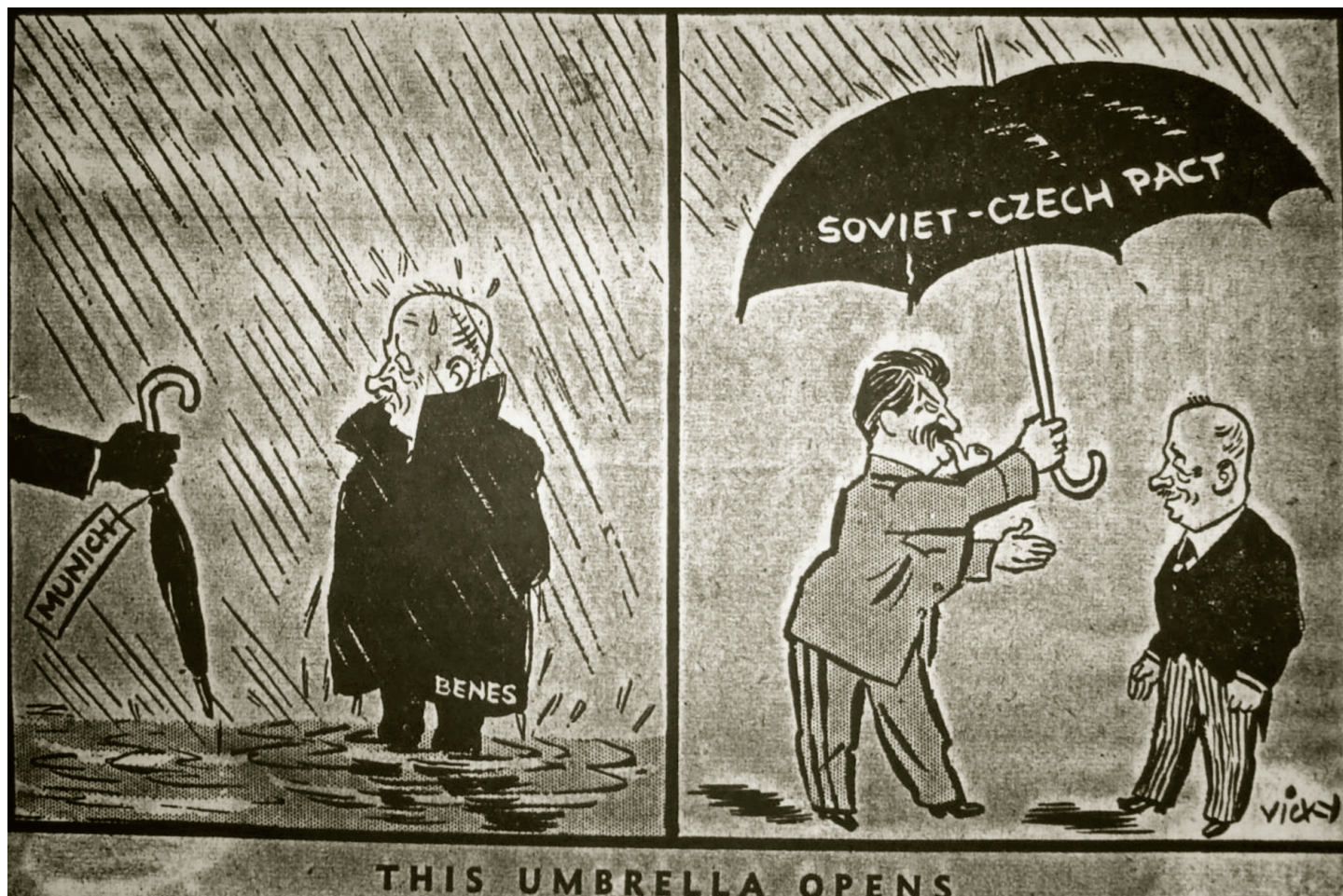
Karikatura k podpisu smlouvy z britského listu News Chronicle 14. 12. 1943