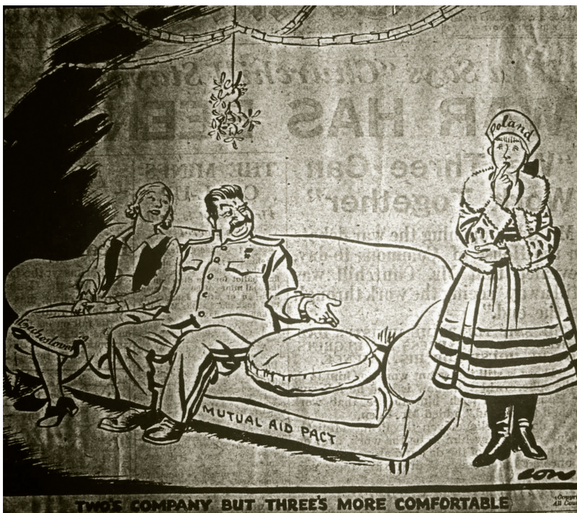
Karikatura k československo-sovětské smlouvě z britského listu Evening Standard 14. 12. 1943