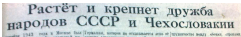
Roste a sílí přátelství národů SSSR a Československa (Pravda 14. 12. 1943)